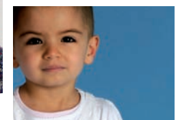
* Hürrem (3)